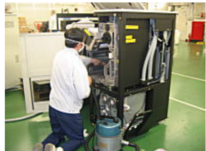
IBM技術員によるクリーニング・検査・構成変更