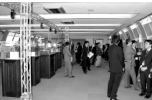
オンデマンド・ギャラリー