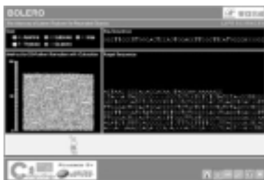
図1. 遺伝子病治療研究プロジェクト向けアプリケーション

東亜合成株式会社による研究プロジェクトです。ヒトの遺伝子情報からの周期性を発見し、病因遺伝子との関係を解析することで、新薬の開発へつなぎます。