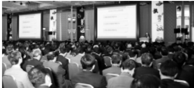
基調講演会場全景

基調講演の会場となったロイヤルパークホテル・ロイヤルホールは開場と同時に多くのお客様が詰めかけ、1,000名を超える来場者の方々の静かな熱気に包まれました。そこに登壇した大歳は、今後の企業経営にとってオンデマンド時代への対応がいかに大切であるかを強く訴えました。講演のあらましは次の通りです。