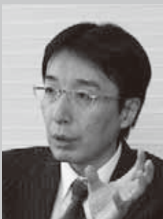
日本アイ・ビー・エム株式会社 テクニカル・リーダーシップ担当 取締役執行役員

Vice President of Human Resources IBM Japan, Ltd.