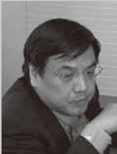
日本アイ・ビー・エム株式会社 人事担当 取締役執行役員