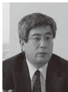
司会： 日本アイ・ビー・エム株式会社 人事、ラーニング&デベロップメント担当