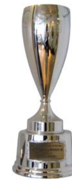
Oracle Award 2007 「Applications Partner of the Year」受賞

このため、IBMのスキルの高さはOracleに認められており、IBMのコンサルタントは、Oracleの「North American Global Systems Integrator Partner of the Year」(2005~2006年)、「Asia Pacific Applications Partner of the Year」(2005年)、「Oracle E-Business Suite Partner of the Year for Japan」(2004~2005年)、および「North American Applications Partner of the Year」(2004年)を受賞している他、日本でもPeoplesoft Award 2005「ダイヤモンドジェネレーション賞」、Oracle Award 2006にて「JD Edwards of the Year」(2006年)を受賞した他、2007年にはOracle AwardでのApplications部門最高賞である「Applications Partner of the Year」(2007年)を受賞しました。