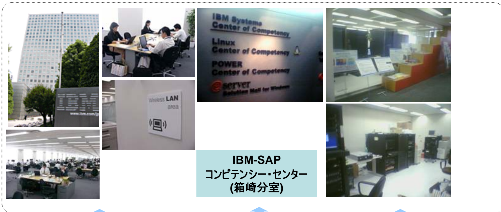
IBM-SAP コンピテンシー・センター (箱崎分室)

SAP社、Microsoft社などISV様との緊密な協業ならびにSAP BASIS エキスパートをはじめIBMトップスキルエンジニアにより、AIX/Linux/Windows/IBM i/zOS プラットフォーム上でのSAP基幹業務構築に対して一体感のある効果的なご支援を実現可能にします (ISCoc = IBM Systems Center of Competencyの略称)