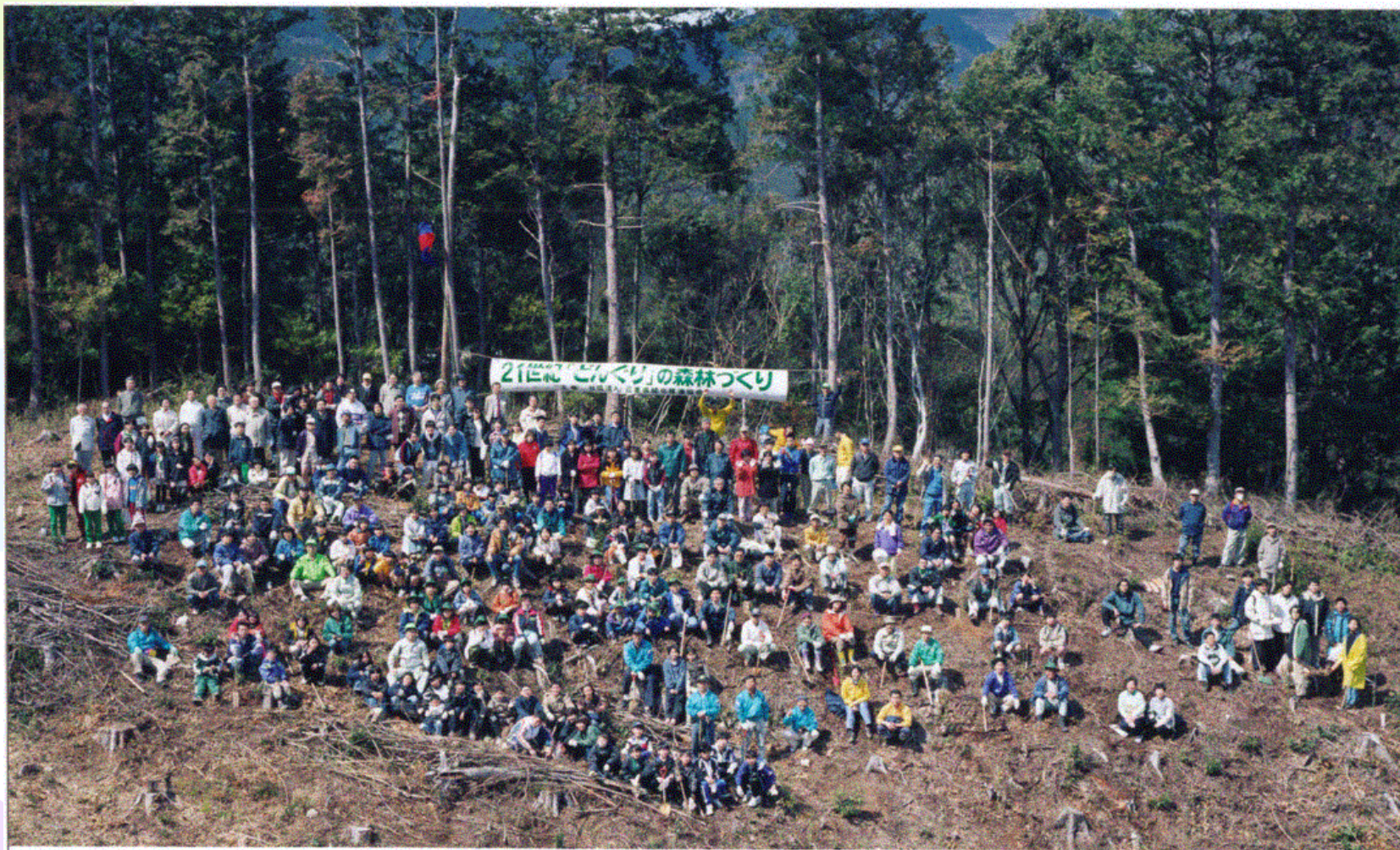
「慶應志木の森・里山」 「21世紀どんぐりの森づくり」 平成10年3月15日