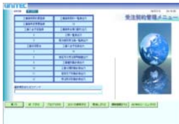
【基幹システムWeb化_受注契約管理メニュー】