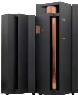
高スケーラビリティ、アプリケーションへの柔軟な対応、64ビット・アーキテクチャーのエンタープライズ・サーバー IBM @server zSeries

NIIとしては、今後、顧客であるJDSへのサービスを向上させるとともに、新しい技術に対応できるよう自社内でスキルを集中、蓄積させていくことができます。もちろん、サーバー統合により、運用管理の大幅な効率化を図ることが可能になっています。