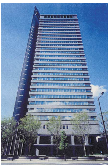
東北電力株式会社 本店ビル

メインフレームの信頼性、可用性をそのままに、 高いオープン性を実現。 最新のオンデマンド機能を搭載した、 IBM @serverの最上位プラットフォーム。 オープンメインフレーム IBM @server zSeries