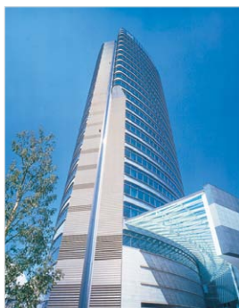
凸版印刷株式会社 小石川ビル