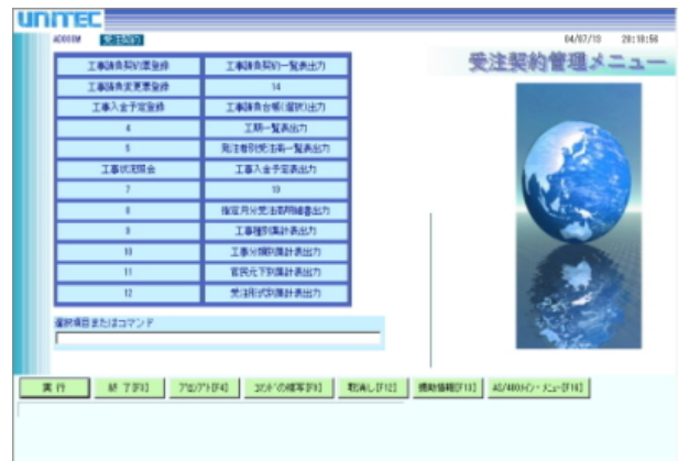
【基幹システムWeb化_受注契約管理メニュー例】