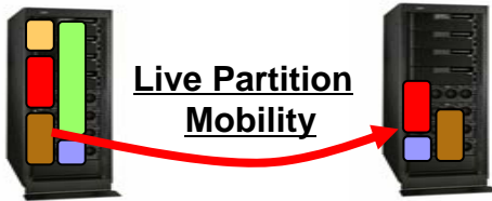
ゲストOS無停止移動により計画停止を削減