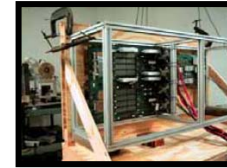
宇宙線の照射によるエラー発生率を測定する実験装置

基幹業務システムの Linux サーバーに 最適なコストバランスでの高信頼性 をご提供します。