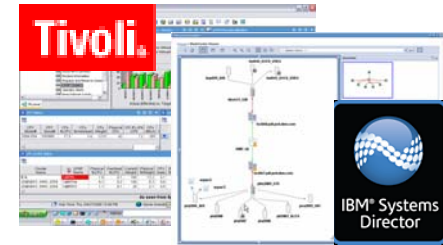
IBM Systems Director, Tivoli により運用・監視