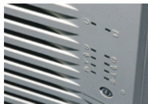
システム・ステータスLED

PC Server 325は、PCのネットワークを支えるプラットフォームとして最適な、ディスプレイ・サイズの省スペース型の本格ミニタワー・サーバーです。